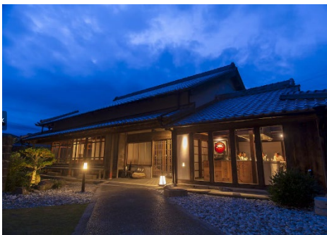
地域を代表する文化財「稲村亭」

5棟目の取組みとして、取り壊し予定だった長屋をモニターやプリンター、プロジェクターなどのオフィス機能に加え、キッチンを備えた中長期滞在向けワーケーション施設に改修。訪日外国人が、周辺の観光地を巡る拠点施設としても利用されるようになっています。