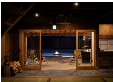
ドッグランを備えたペット可の客室