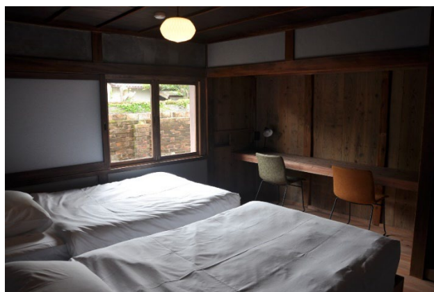
レトロな雰囲気が残る元たばこ店をリノベーションした「益野邸」の客室