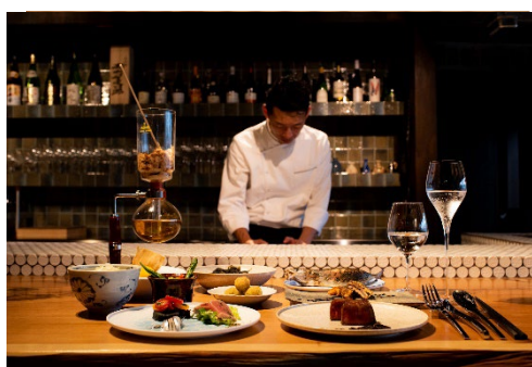
マグロなど串本らしい食が楽しめる