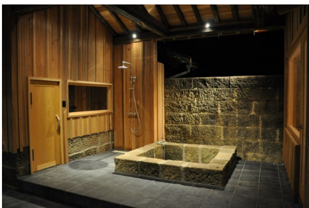
地元産石材「宇津木石」を使ったプライベートサウナの水風呂

当ホテルは2019年2月の開業。以来、空き家となった複数の古民家を面的に活用し、歴史ある町並みを保全する観光まちづくりプロジェクトとして串本の旧市街地全体で展開しています。地域の歴史・文化・食などが持つ本質的な価値を伝える体験を提供し、地域に波及効果を生む仕組みづくりを目指して、今後も串本の歴史的資源の活用を継続していきます。