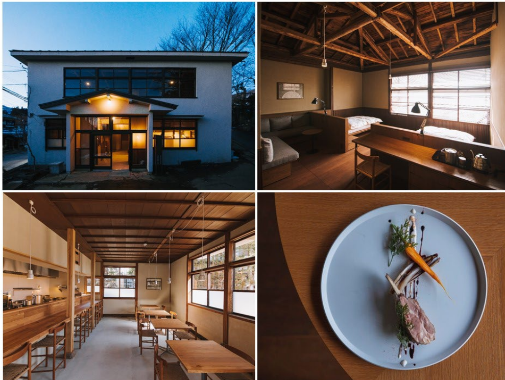
空間デザイン：Luft、料理監修：小川智寛（LULL、エルブランシュ）

RITA 戸隠のオープンで、つぎとが展開するホテルブランド「RITA」は、鹿児島県出水市や福岡県八女市などに続く5施設目となります。